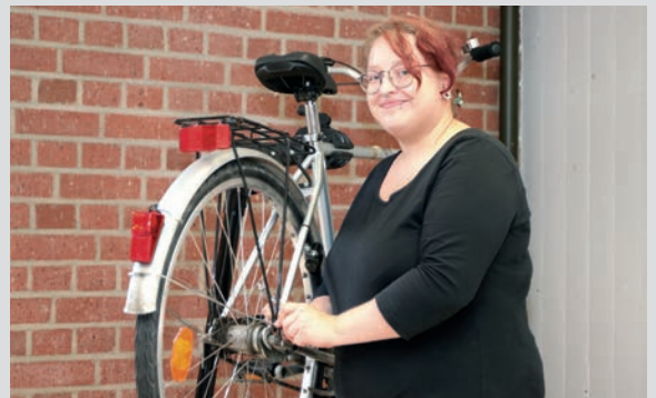
Eine Teilnehmerin überprüft das erste Fahrrad auf dem Reparaturständer.