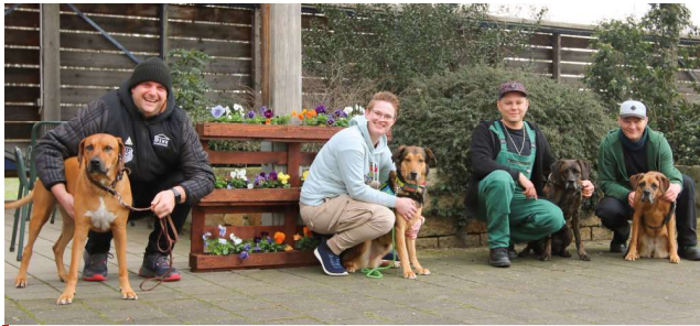
Vier Teilnehmende, die ihre Hunde ins BFW Nürnberg mitbringen dürfen.

Tiere können den Maßnahmeerfolg steigern und sogar Unfälle verhindern