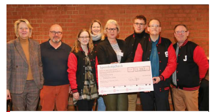
Symbolische Spendenübergabe im BFW Nürnberg.

Es ist mittlerweile schon Tradition: wenn BFW-Teilnehmende feiern, wird auch immer gesammelt und für einen guten Zweck gespendet. Diesmal wurde die Zabo-Diakoniestation beschenkt.