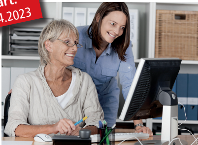
Händeringend gesucht: Fachkräfte im Case- und Belegungsmanagement

Die viel diskutierte Überlastung in pflegerischen und medizinischen Berufen führt immer häufiger dazu, dass Betroffene ihre Tätigkeit nicht mehr ausüben können. Da viele jedoch die Branche nicht ganz verlassen wollen, ist eine Weiterbildung zum/zur Case- und Belegungsmanager/-in im Gesundheits- und Sozialwesen eine vielversprechende Option.