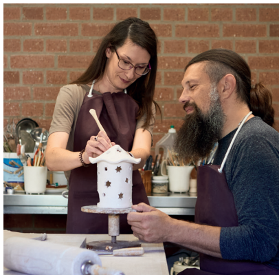
Einer der beliebtesten PlusPunkte-Kurse überhaupt ist das „Töpfern – Kreatives in Ton“.

Für Teilnehmende aus den Hauptmaßnahmen stehen wieder viele Kurse aus der PlusPunkte-Reihe zur Auswahl. Das Portfolio reicht von Aufbesserung von kaufmännischem Wissen oder Sprachkenntnissen bis zu Sport- und Freizeitangeboten – neue Themen werden genauso mit aufgenommen wie altbewährte Angebote. Verpflichtend ist, mindestens einen Kurs innerhalb der Umschulungszeit zu belegen. Allen gemeinsam ist das Vermitteln von wichtigen Kompetenzen.